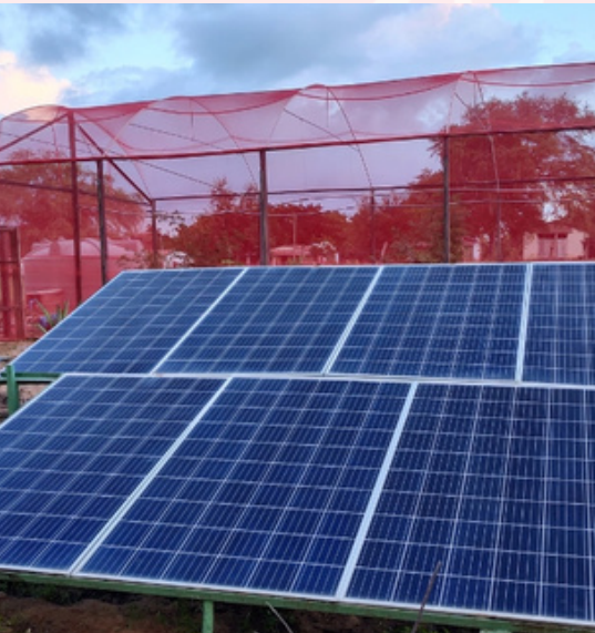
Kleber Nunes/ASA Brasil

Durante a 17ª edição da “Marcha pela Vida das Mulheres e pela Agroecologia”, em Remígio (PB), no mês de março, foi lançado o projeto “Um Milhão de Tetos Solares”, uma parceria entre a Fundação Banco do Brasil e a Articulação do Semiárido Brasileiro (ASA). O P1MTS vai beneficiar famílias do semiárido nordestino, promovendo a geração de energia solar de forma acessível e sustentável, com foco em formação profissional e geração de renda.