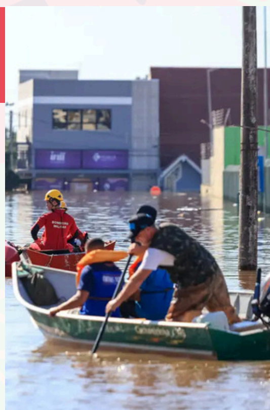
Gustavo Mansur/Palácio Piratini

A Câmara dos Deputados aprovou, no mês de junho de 2026, o Projeto de Lei nº 1.707 de 2025. De autoria da Presidência da República, a proposta estabelece medidas excepcionais para enfrentar os impactos de estados de calamidade pública nas parcerias entre a administração pública e as organizações da sociedade civil. As novas regras permitem a criação de parcerias emergenciais, a alteração de planos de trabalho e a simplificação da prestação de contas, visando uma resposta mais ágil e eficaz em situações de emergência. O projeto será apreciado no Senado.